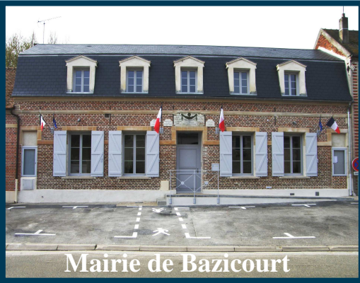
Mairie de Bazicourt